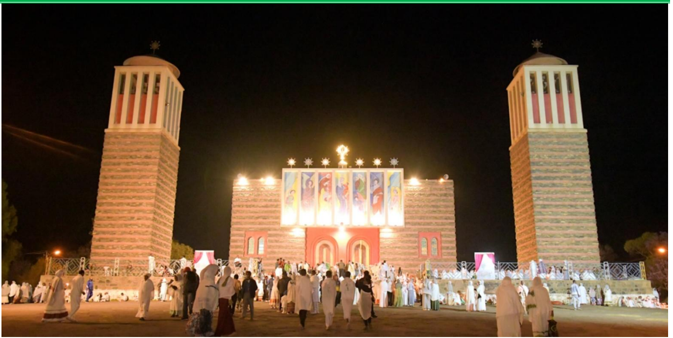
Ostern wurde landesweit farbenfroh gefeiert