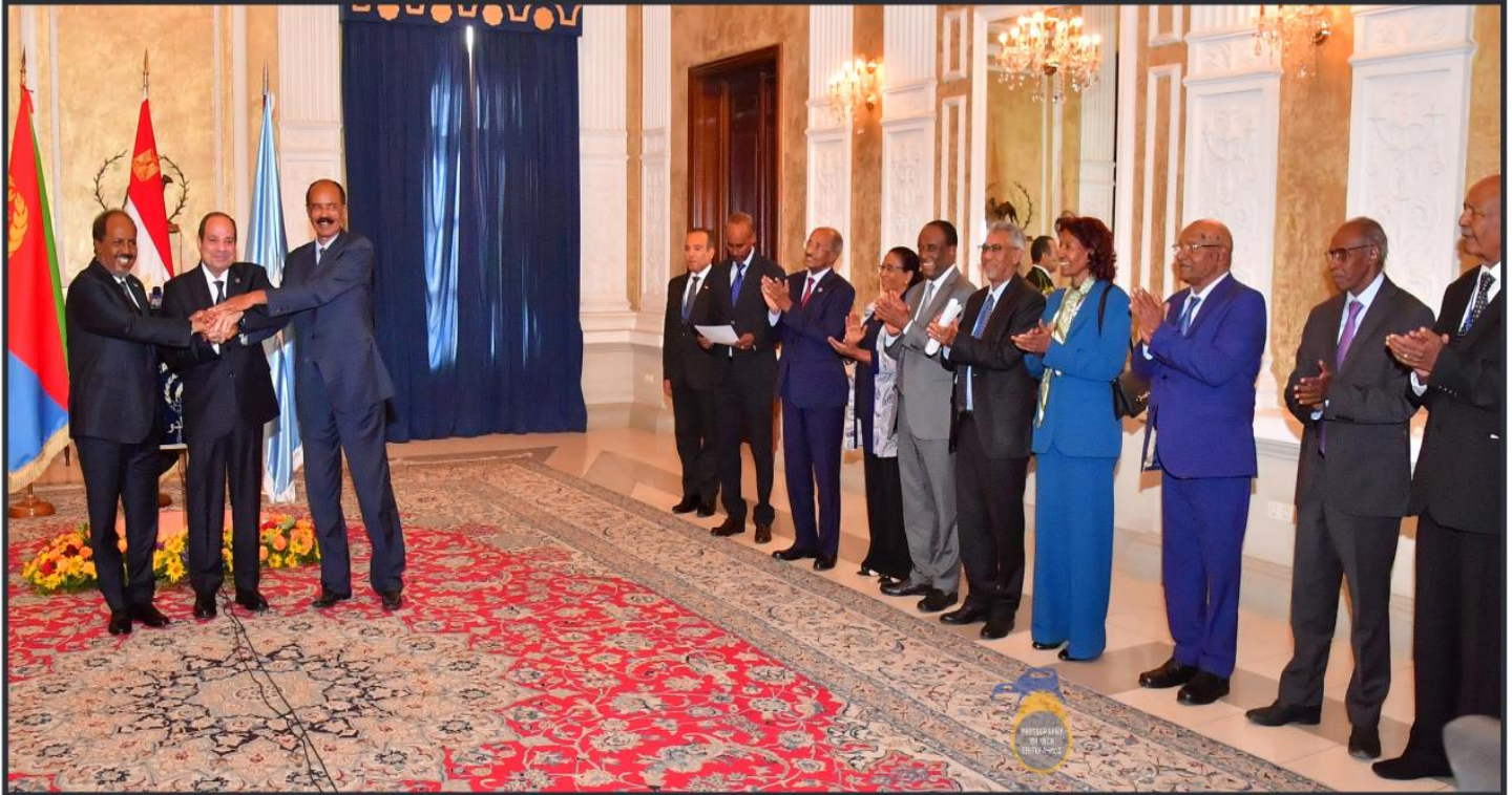
Somalias Präsident Hassan Sheikh Mahmoud, Ägyptens Präsident Abdel Fattah el-Sisi und Eritreas Präsident Isaias Afwerki.