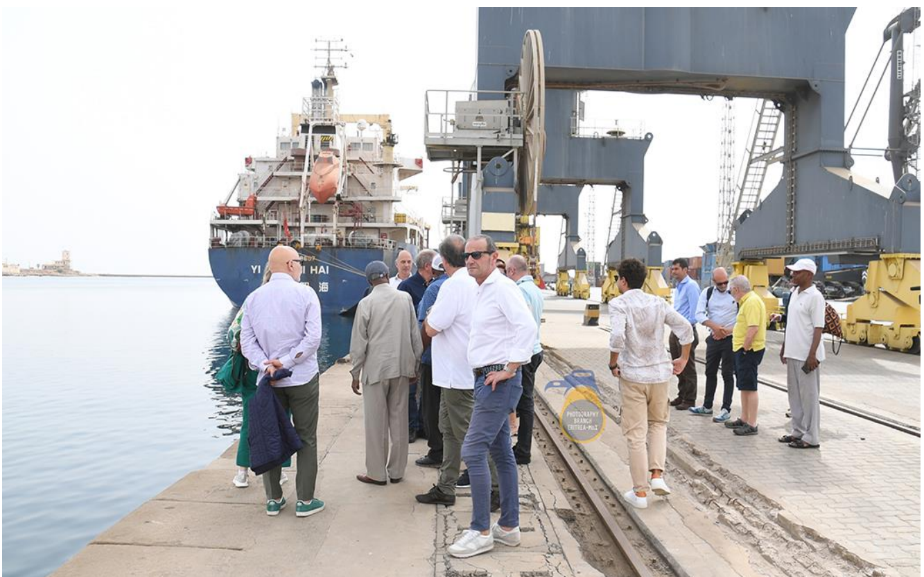
Italienischen Delegation in der nördliche Rotmeerregion